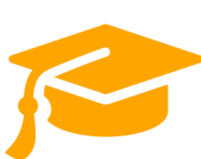
Starptautisks mācību centrs