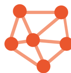
Starptautiska nozares asociācija